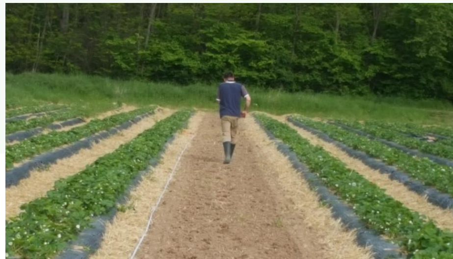
Semis de la bande fleurie (mélange de centaurée barbeau, souci double, zinnia lilliput, cosmos sensation et lavatère) + roulage