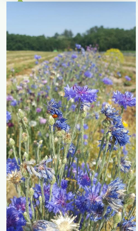
Floraison : 3 à 4 semaines. Puis à l'automne fauchage et broyage de la bande fleurie, elle peut refleurir d'une année sur l'autre