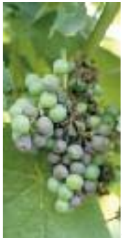
Mildiou Plasmopara viticola .

1 Replacement of copper fungicides in organic production of grapevine and apple in Europe 2 Istituto Agrario di San Michele All'adige