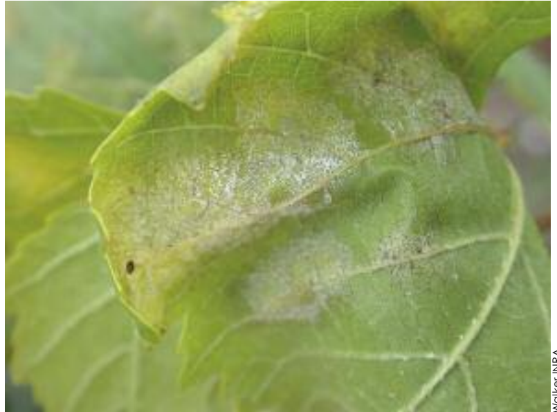
Attaque tardive de mildiou.

Les résultats du projet soulignent l'intérêt d'un traitement cuprique afin de maîtriser le mildiou. Il semble donc difficile de se passer totalement du cuivre. Néanmoins, trois points paraissent intéressants. - Le premier concerne la réduction des doses de cuivre. En effet, les années à faible pression mildiou, les traitements avec un cuivre à dose réduite peuvent être aussi efficaces que ceux avec la référence cuivre et