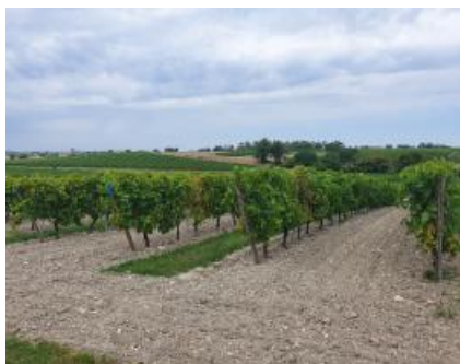
Parcelle Juillac le Coq