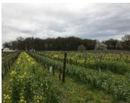
Engrais verts : mélange Avoine rude, Féveroles et Moutarde.