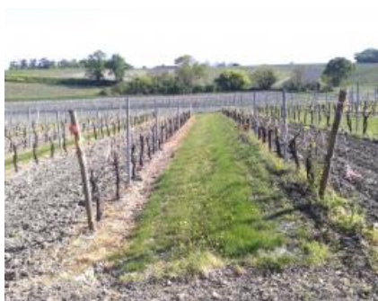
Différence d'entretien du sol