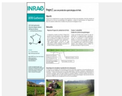
Plaquette Projet Z Gotheron INRAE revised Mars 2020