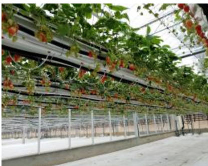
Hors sol fraise