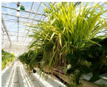
Vue d'ensemble : plantes relais et fraisier