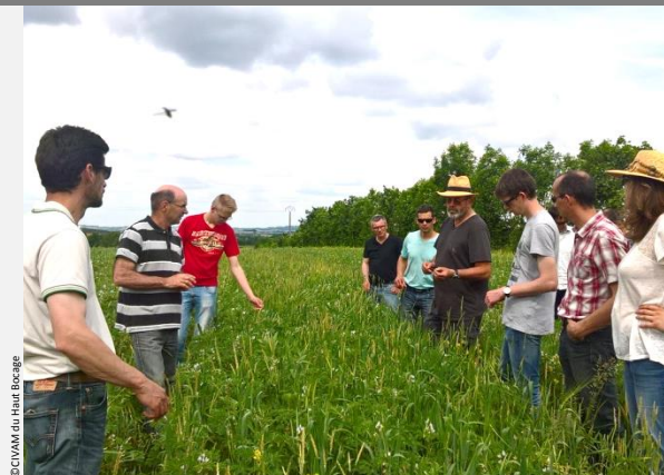
CIVAM du Haut-Bocage