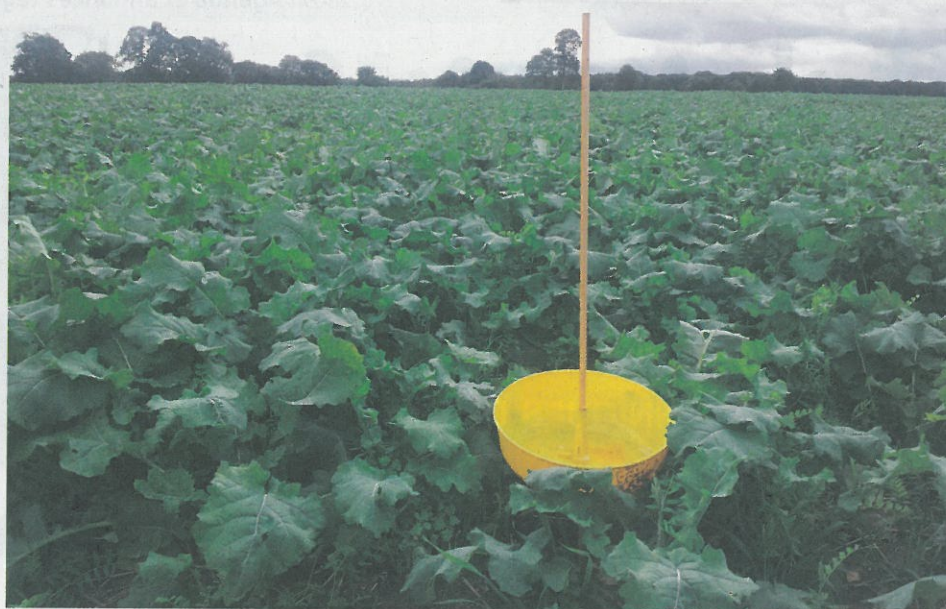
▲ Une parcelle de colza avec couvert associé semée au 27/08/2012, sans désherbage.

C'est dans cette optique que le groupe s'est réuni en septembre pour réaliser le bilan de la campagne céréales et colza. Par un simple questionnaire sur la satisfaction de la campagne, la contrariété, et les décisions à prendre, se sont engagés des échanges qui ont enrichi le groupe. Plusieurs ont exprimé une déception face au rendement obtenu en blé dans les sols profonds. Tous ont fait part de leur difficulté d'appréhender le risque maladies car des conduites fongicides à 2 ou 3 passages ont abouti au même niveau de rendement. D'où la résolution pour le semis à venir, exprimée par 2 d'entre