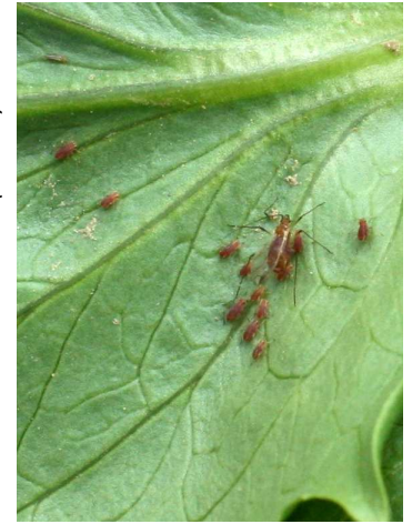
Puceron nasonovia (CA BZH)