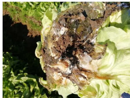
Attaques de Sclérotinia sur salades