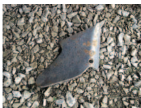
Oreille de cochon

3 à 4 personnes sont embauchées pour piocher et tournent tous les deux ans sur 2 ha.