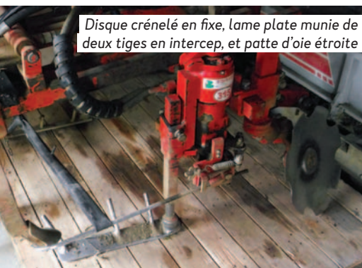
Disque crénelé en fixe, lame plate munie de deux tiges en intercep, et patte d'oie étroite

Le vibroculteur est préférable au covercrop dont le dernier disque fait une petite saignée juste à l'endroit où le tracteur roule, engendrant une mauvaise stabilité, bien que cet outil passe mieux que les griffes en terrain humide.