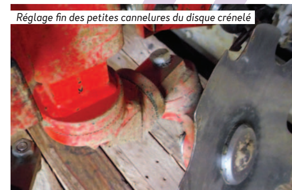
Réglage fin des petites cannelures du disque crénelé