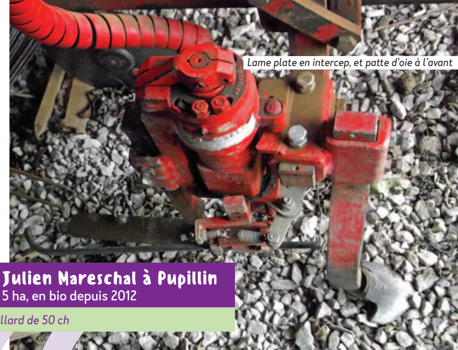
Lame plate en intercep, et patte d'oie à l'avant

Action pilotée par le Ministère chargé de l'Agriculture, avec l'appui financier de l'Office National de l'Eau et des Milieux Aquatiques, par les crédits issus de la redevance pour pollutions diffuses attribués au financement du plan Ecophyto