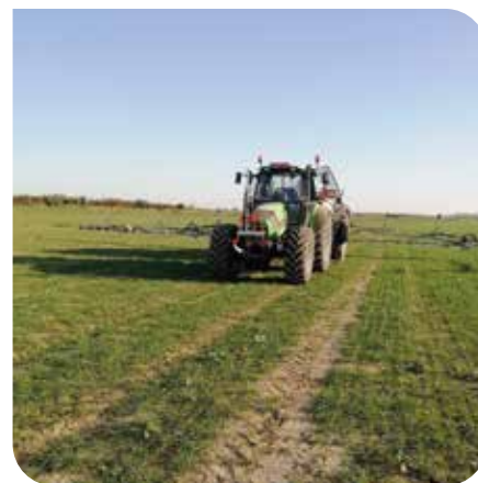
Pulvérisateur équipé de capteurs embarqués permettant le spot-spraying.

Même si ces technologies sont encore très jeunes, elles se développent très rapidement et les premiers résultats obtenus, même s'ils doivent encore être confirmés lors des saisons 2021 et 2022, semblent encourageants pour un déploiement de ces technologies dans le monde agricole wallon.