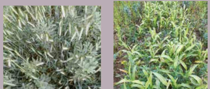
Mélanges d'espèces et/ou de variétés