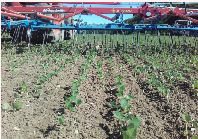
Légende : herse étrille sur soja

Cette expérience permettrait d'imaginer un prolongement sur l'ensemble de l'exploitation à condition d'une durabilité technique et économique du système.