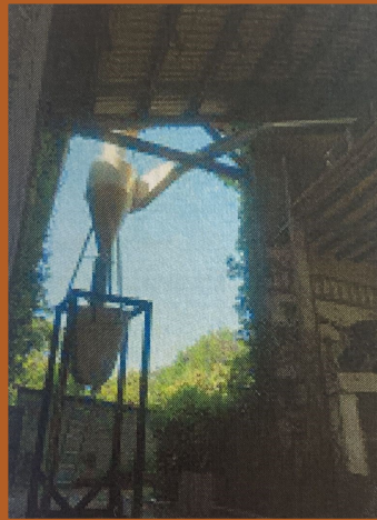
Cyclone d'élimination des déchets légers