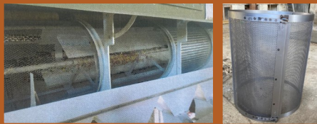
Crible rotatif et grilles interchangeables