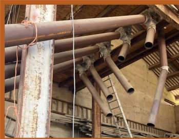
Tuyaux qui dirigent le grain vers les bennes / big bag

5. Le grain forme un rideau en passant entre la trappe à contre-poids et le rouleau engreneur. La ventilation aspire une première partie des déchets légers du rideau.