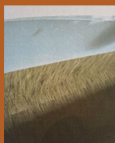
Boîte de chute et rideau de grains