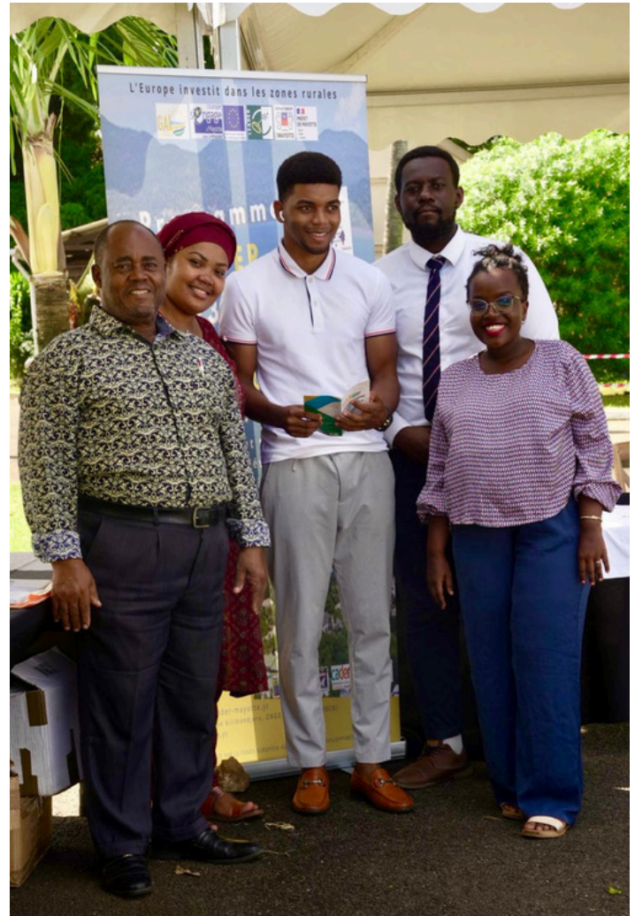
Le référent RNAR, les représentants des GAL et l'animateur Leader

D'éventuels porteurs de projets se sont manifestés pour l'agroalimentaire et un projet atypique d'encadrement de la main d'œuvre d'origine étrangère dans le domaine de l'agriculture mahoraise.