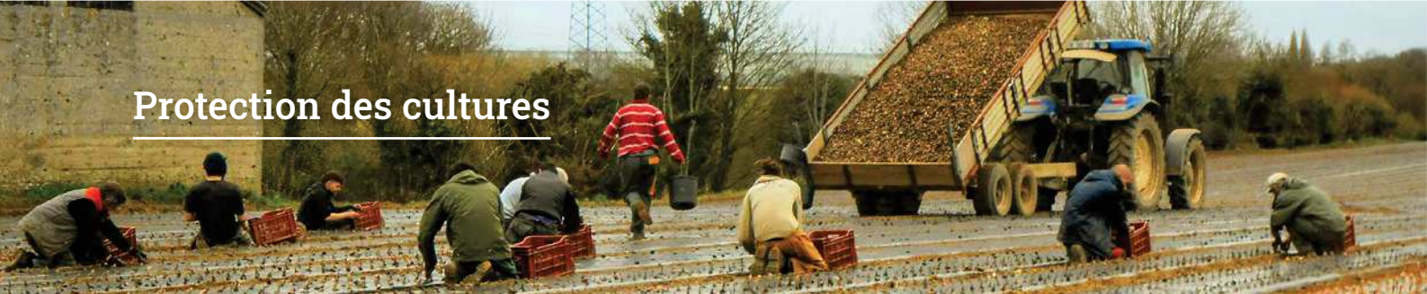
La plantation de l'échalote est faite manuellement.