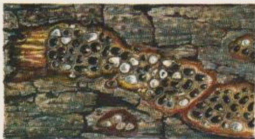
Coupe tangentielle des périthèces (aspect en alvéoles)