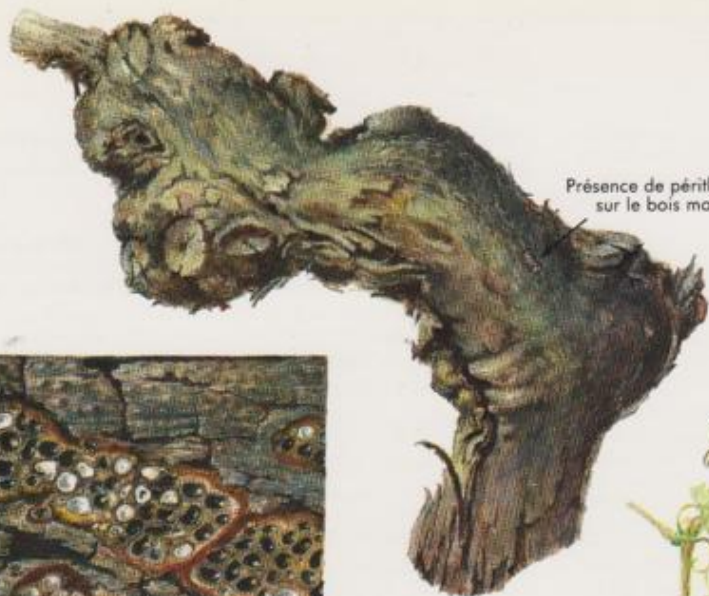
Présence de périthèces sur le bois mort