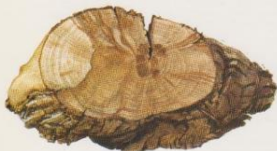
Nécroses brunes dans le bois