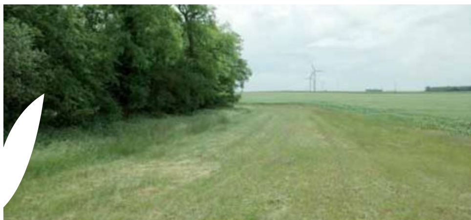
Bordure de champ adjacente à un bois, protégée par une bande enherbée, favorisant l'apparition d'espèces sauvages de type forestière