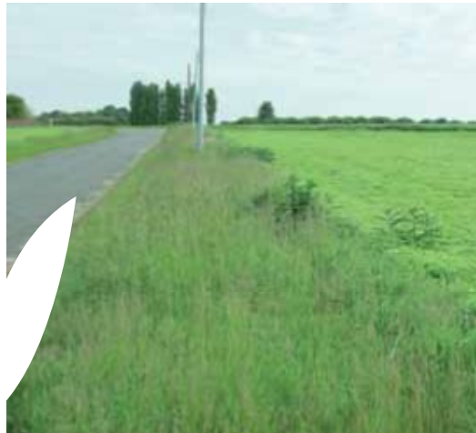
Les bordures de champs adjacentes à une route : un maillage important pour la circulation de la biodiversité !