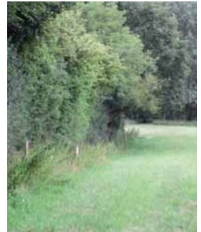
Bordure de prairie adjacente à une haie (Perche).