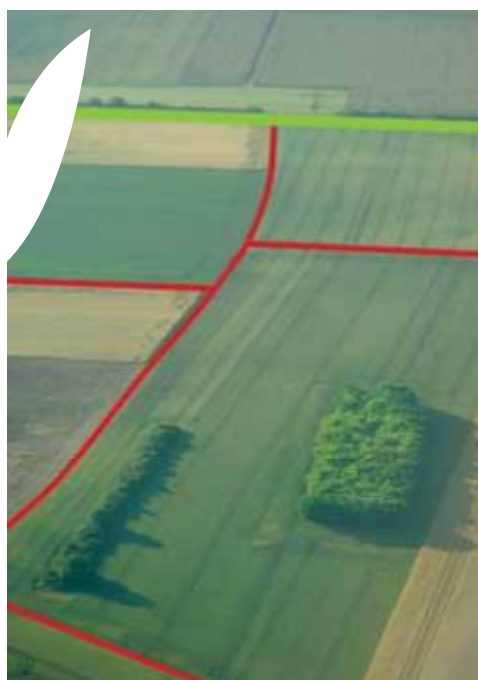
Importance des bordures de champs dans les continuités écologiques.

de floraison influencent beaucoup ces populations qui ne peuvent pas compter sur le potentiel alimentaire des cultures (trop faible ou trop court dans le temps). La présence de légumineuses (luzerne, trèfle) sur une bordure de champ est favorable à l'abondance et à la diversité de ces espèces. Il convient de mettre en place une gestion qui doit s'efforcer de ne pas éliminer trop précocement les inflorescences porteuses de pollens et de nectars indispensables.