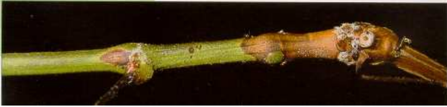
Défaut d'aoûtement sur vigne ( Vitis vinifera )