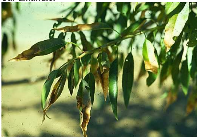
Brûlure foliaires sur amandier ( Prunus dulcis )