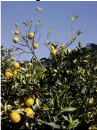
Chlorose panachée des agrumes (CVC) sur oranger ( Citrus sinensis )