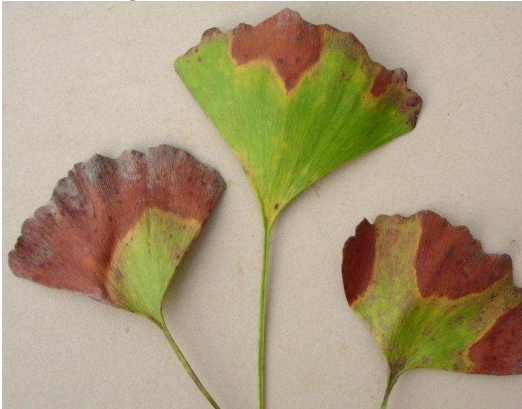
Brûlures foliaires sur ginkgo ( Ginkgo biloba )