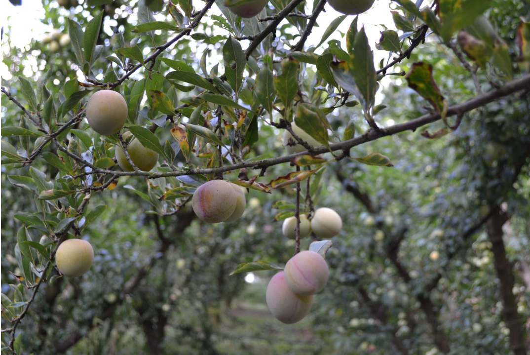
Brûlures foliaires sur prunier ( Prunus domestica )