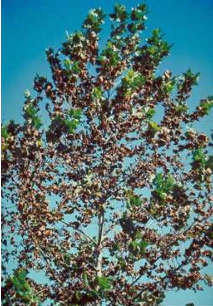
Brûlures foliaires sur Platane sycomore ( Platanus occidentalis )