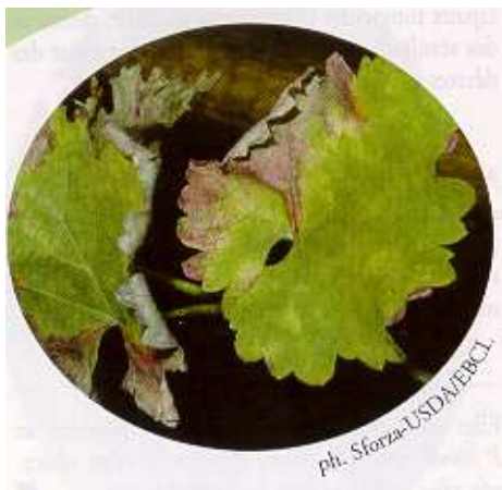
Dessèchement sectoriel du limbe sur vigne ( Vitis vinifera )