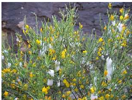
Genêt colonisé par des larves de Philaenus spumarius entourées de leur mousse.

Les outils de tailles, ou autres outils provoquant des blessures sont également à l'origine de la dispersion de la maladie de plante à plante, bien que ce mode de transmission n'ait pas été décrit comme très efficace.