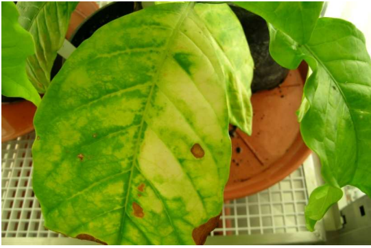
Chlorose et taches nécrotiques sur caféier ( Coffea sp.)