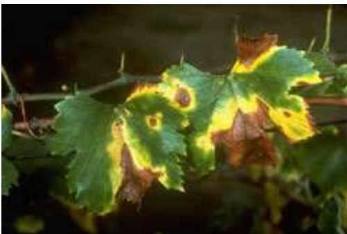
Maladie de Pierce sur vigne ( Vitis vinifera ) - Symptômes sur cépage. Chardonnay