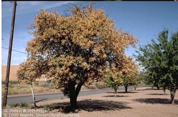
Brûlure foliaires sur amandier ( Prunus dulcis )