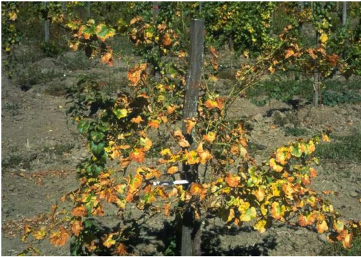
Maladie de Pierce sur vigne ( Vitis vinifera ) - Symptômes sur cépage. Chardonnay (sous stress hydrique)