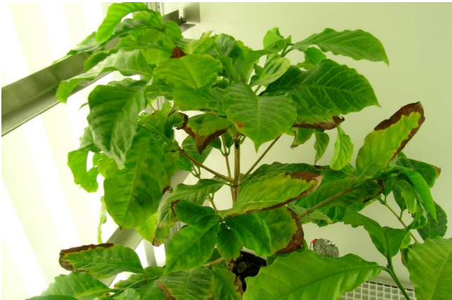
Chlorose et dessèchement marginal des feuilles sur caféier ( Coffea sp.)