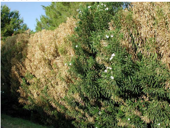
Brûlures foliaires sur laurier rose ( Nerium oleander )