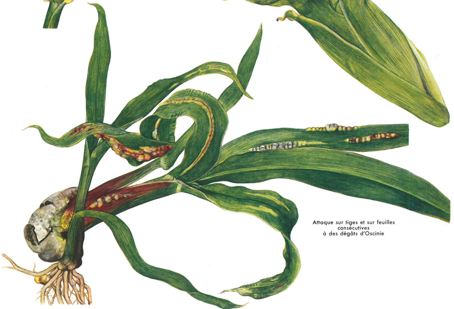
Attaque sur tiges et sur feuilles consécutives à des dégâts d'Oscinie