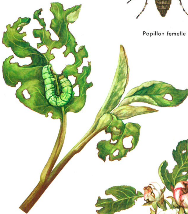
Larve et dégats sur feuilles