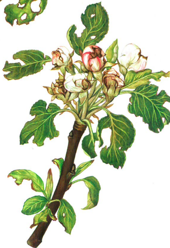
Dégats sur fleurs