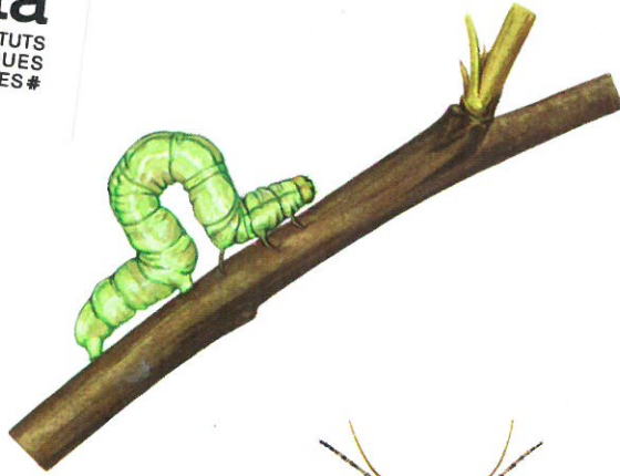
Chenille déambulant (Chenille arpenteuse)