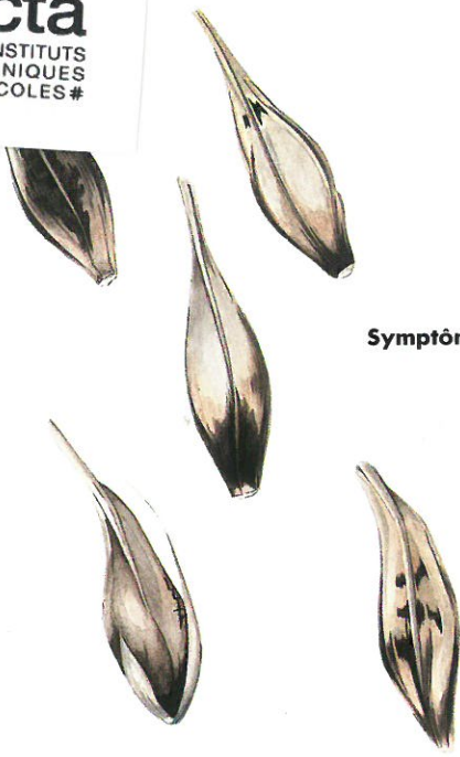
Symptômes sur grains