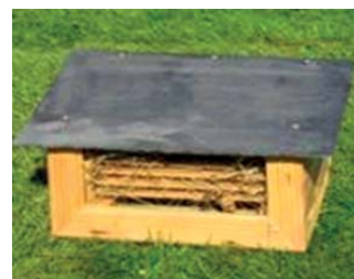
Abri pour coccinelles de Société d'Horticulture de Touraine