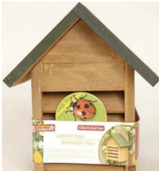
Exemple d'abri du commerce

Il existe plusieurs abris artificiels dans le commerce. Il faut respecter les mêmes règles que pour les abris maison :